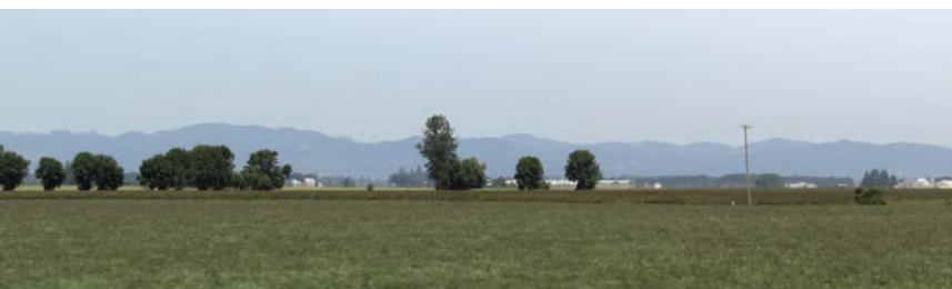
Alm. rajgræs på Willamette Valley

Den 17.-19. maj er der arrangeret en post-tour til Central Eastern Oregon øst for bjergkæden Cascade Mountains. På denne tur vil der blandt andet være besøg hos frøavlere af guleros og engrapgræs. Læs mere om konferencen og tilmelding på www.ihsg2019.org