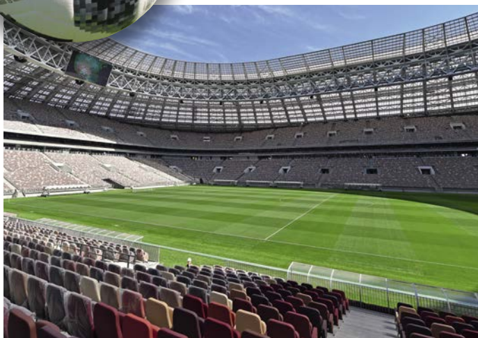
Luzhniki stadion i Moskva er vært for både åbningskamp og finale

I foråret 2018 har Luzhniki anvendt en plænegræs-blanding til oversåning, der består af de bedste diploide plænerajgræsser og 4turf sorter.