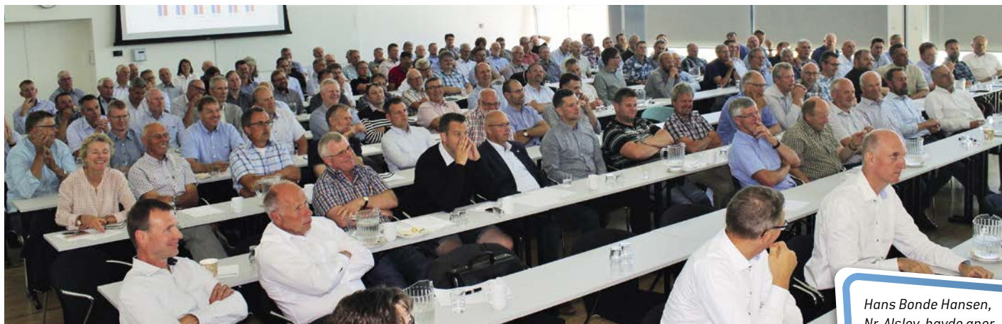
Godt humør hos de delegerede, der at par dage forud for mødet var finalafregnet for høst 2017