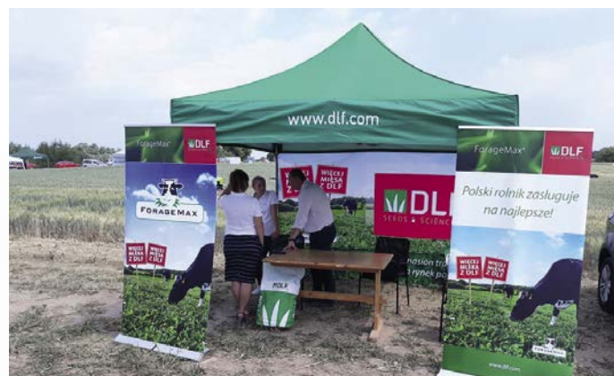
Klar med DLF standen på en af de mange polske landbrugsudstillinger

”Vi er lykkedes med at rekruttere medarbejdere med erfaring og viden om frø fra praksis”