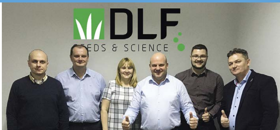
Seks ud af de syv medarbejdere i det polske DLF-team