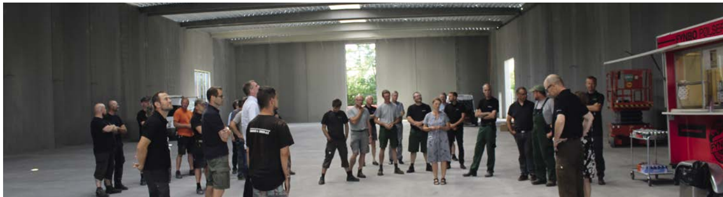
Rejsegilde for ny renvare lagerhal i Jensen Seeds i juni 2018

Hybrid spinat er populært overalt i verden, og Jensen Seeds er godt rustet til at producere frøet hos vores mange kompetente avlere. Hidtil har vores renserier haft den fornødne kapacitet, men med den stigende efterspørgsel er der behov for investering i ny rensekapacitet. Den nye renselinje har en kapacitet på 1.700 kg renvare pr. time, og med rengøringer og sortsskift kan den levere 200 tons renvare pr. måned. Renselinjen får et siloindtag tilknyttet, så vi undgår at fylde kasser med råvare. Renselinjen er full-line og har både farve- og størrelsessortere, så vi kan gøre varen færdig til kunden. Farvesorteren har 60 kanaler med fuld farve- og formgenkendelse. Den større rensekapacitet betyder også, at vi har udvidet vores tørreri med 30 pct.