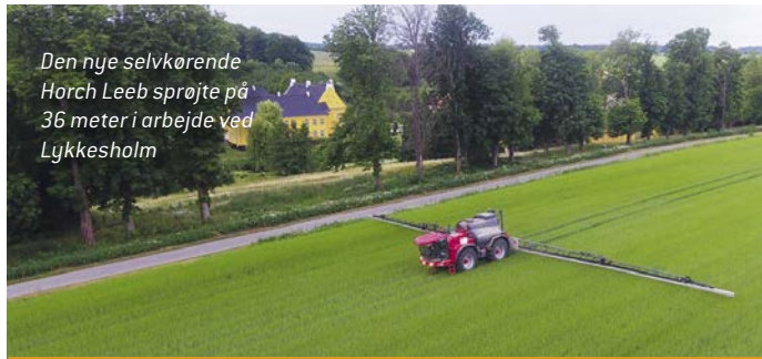
Tabel 1 Maskinoversigt

I forbindelse med etableringen af Agro-Alliancen er der skiftet en del ud i maskinparken. Der er generelt skiftet til færre, men større maskiner. Eksempelvis er tre mejetærskere blevet til to, og der er indkøbt en stor selvkørende sprøjte på 36 meter samt en ny såmaskine. Tabel 1 viser en oversigt over de vigtigste maskiner.