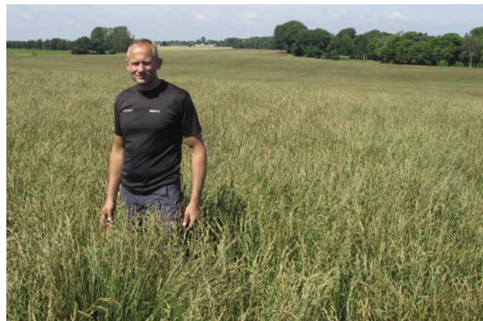
2. års strandsvingel Olympic Gold har klaret tørken forbavsende godt