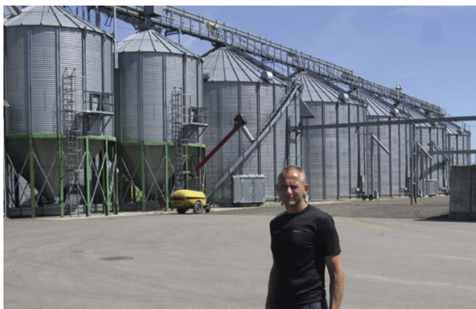
Siloanlægget der bruges til indtagning af raps for DLF, samt naturligvis korn for Agro-Alliancen